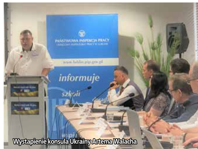
Wystąpienie konsula Ukrainy Artema Walacha