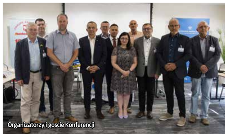
Organizatorzy i goście Konferencji

krajów przyjmujących największą liczbę pracowników delegowanych z krajów trzecich w budownictwie. (...) Od 24 lutego znajdujemy się jednocześnie w innej rzeczywistości w obszarze polityki, gospodarki i rynku